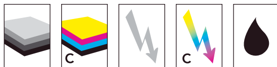
Kopierer Farbkopierer Laser Farblaser Inkjet

Die Büropapiere und Folien von Fischer Paper AG sind durch Symbole klassifiziert. Damit finden Sie einfach und sicher das Material, welches für Ihr Drucksystem geeignet ist.